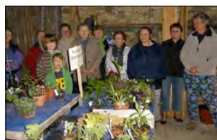
Habitants de Longecourt les Culètre