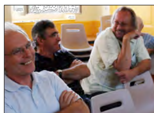
Futurs accédants de l'ecohameau

Architectes: Atelier Zéro Carbone Architectes